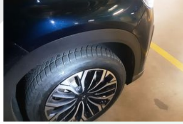
Sağ Ön Lastik