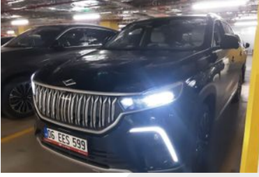
1. Sol Ön Çapraz