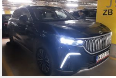
2. Sağ Ön Çapraz