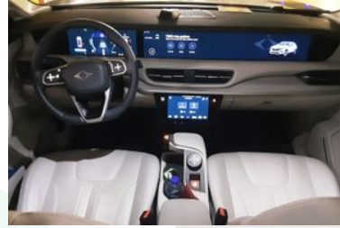
6. Araç için ön konsol