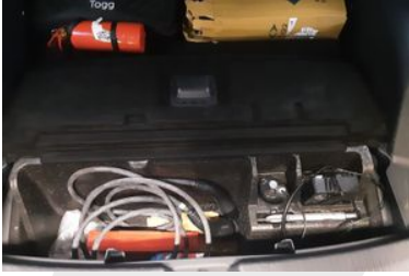
STEPNE VEYA TAMİR KİTİ