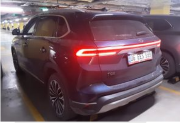
4. Sol Arka Çapraz