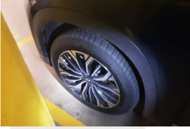
Sol Ön Lastik