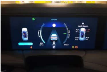
11. Araç için kadran