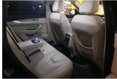
8. Araç için sağ arka sıra