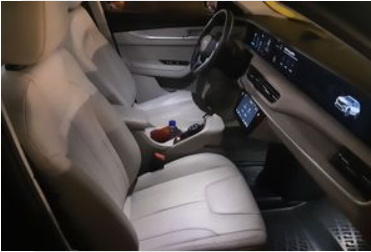
7. Araç için sağ ön sıra