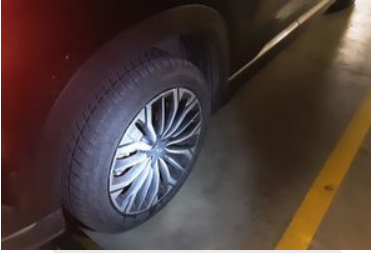
Sağ Arka Lastik