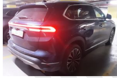
3. Sağ Arka Çapraz