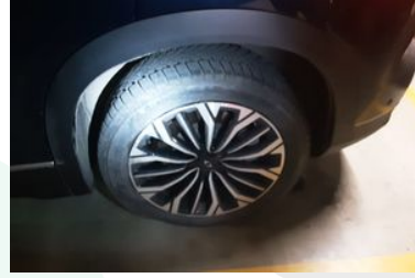
Sol Arka Lastik