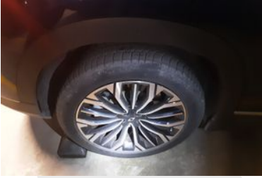
Sağ Arka Lastik