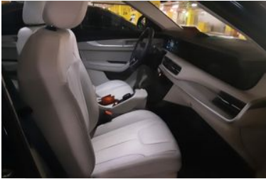
7. Araç için sağ ön sıra