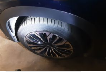
Sol Ön Lastik