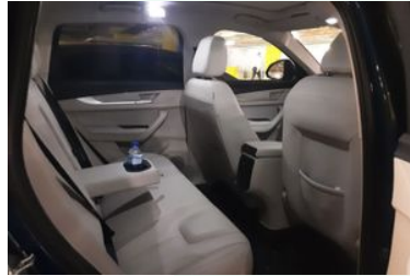
8. Araç için sağ arka sıra