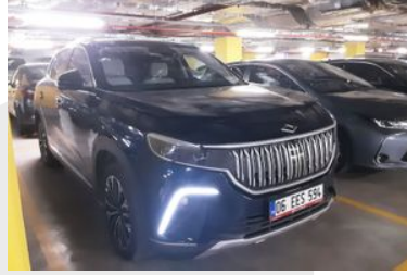
2. Sağ Ön Çapraz