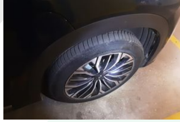
Sağ Ön Lastik