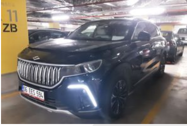
1. Sol Ön Çapraz