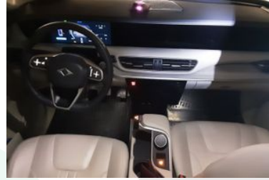
6. Araç için ön Konsol