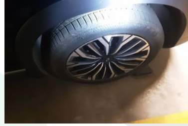
Sol Arka Lastik