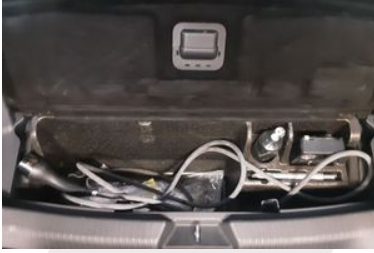
STEPNE VEYA TAMİR KİTİ