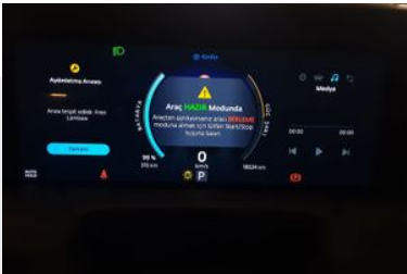
11. Araç için kadran