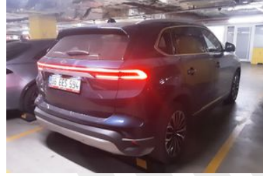
3. Sağ Arka Çapraz