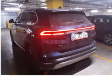
4. Sol Arka Çapraz