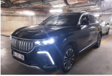
1. Sol Ön Çapraz