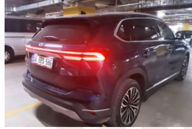
3. Sağ Arka Çapraz