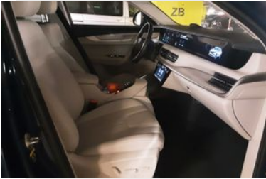
7. Araç için sağ ön sıra