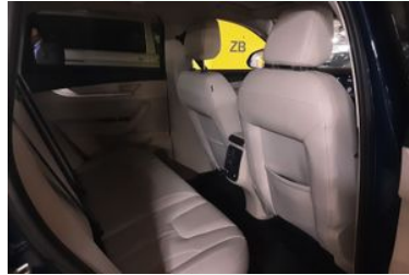
8. Araç için sağ arka sıra