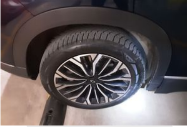
Sağ Arka Lastik