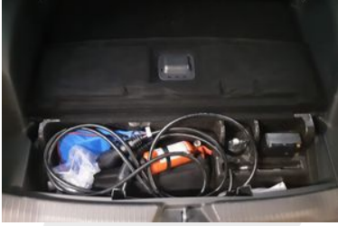
STEPNE VEYA TAMİR KİTİ