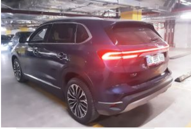
4. Sol Arka Çapraz