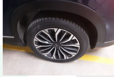
Sol Arka Lastik