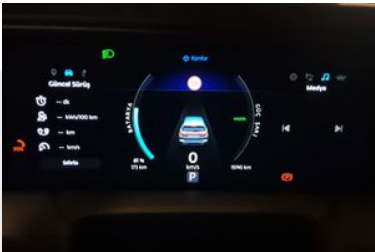
11. Araç için kadran