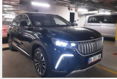
2. Sağ Ön Çapraz