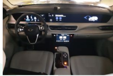
6. Araç için ön konsol