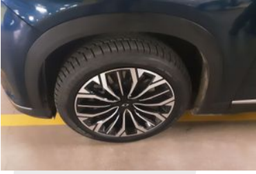
Sol Ön Lastik