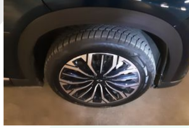
Sağ Ön Lastik